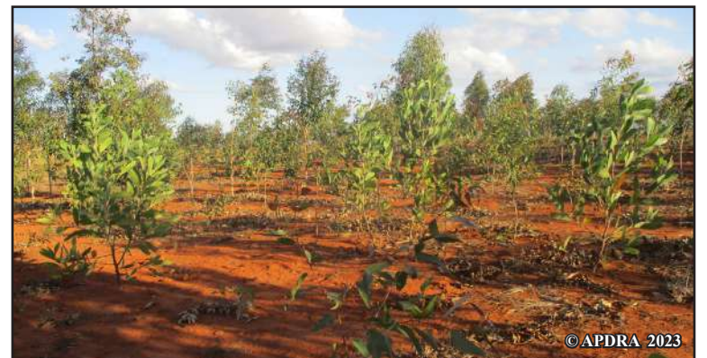
Hazo voavoly teo amin'ny tanetin-dRamasy

ny 24 amin'ireo. Mamokatra zana-kazo 40 000 isan-taona aho : amin'ny maha-filohan'ny fikambanana ahy dia omeko ny mpikambana ny 10 000, amidy amin'ny fokontany hafa ny 5 500 ary ny ambiny kosa amidy amin'ny kaominina hafa, iaraha-miasa amin'ny Fitaleavam-paritry ny Tontolo iainana sy ny Fampandrosoana Lovain-jafy. Voafidy hanokafana ara-pomba ofisialy ny fotoam-pambolen-kazo tato amin'ny faritra Matsiatra Ambony ny tanànanay tamin'ny 2021. Velaran-tany mirefy 30 ha no voavoly hazo. Ny fikambanana no mikojakoja ny hazo voavoly sy manolo izay maty. Manantena ny hahazo rano bebe kokoa izahay amin'ny hoavy. »