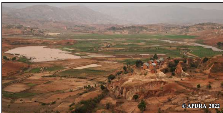
Fitsidihana sahan-driaka iray tao amin'ny kaominina Antoby Est

Namory ny mpiompy trondro aloha ny ekipan'ny tetikasa hamaritana ny zava-misy sy manahirana azy ireo eny ifotony, voakasik'izany ny tanàn'i Miantsoarivo sy ireo tompon'ny tanety monina ao Andriakely, tanàna mpifanolo-bodirindrina aminy. Nanazava ireo mpamokatra fa ny fihotsahan'ny tanety no olana fototra tokony hovahana. Io tranga io no mahatonga ny ankamaroan'ny tanimbary azo iompiana sy ambolena ary ireo farihy voajanahary ho tototry ny antsanga. Nisy taorian'izay