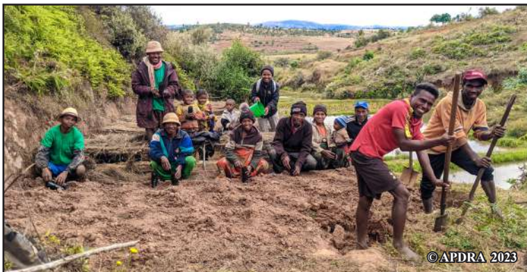
Ny mpikambana nandritra ny asam-bondrona iray

Namorona tanin-janan-kazo iombonana koa izahay ka iaraha-manao ny asa. Any amin'ny toerana voafidin'ny mpikambana no hambolena ny zana-kazo mba ho fakan-tahaka ho an'ny tantsaha hafa. Vinavinaina ny hamokatra mandavantaona hoenti-mandrakotra ny tanetinay. Hovolena hazo ny sahan-driaka tsirairay mba hanan-danja bebe kokoa ny fiantraikany. Hanao tsipaipaika izahay ary hanohy ny fikarakarana savika izay efa fanaonay hampitombo vola hividiana masomboly sy hikojakojana ny tanin-janan-kazo. »