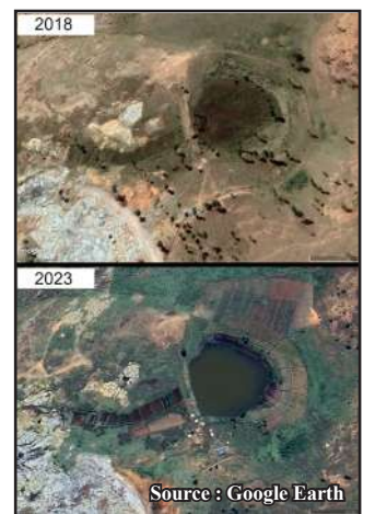
Ny toeram-pamokaran'ny fikambanana tamin'ny may 2018 (ambony) sy aprily 2023 (ambany)

FMTA : Hatreto aloha dia namidy ho tombontsoan'ny fikambanana ny vokatra niakatra : ny voalohany nentina nanorina ny tranon'ny mpiambina ny toerana (izay mpikambana ihany) ary ny faharoa nananganana ny fotodrafitrasa fandritana. Ny vola azo avy amin'ny vokatra fahatelo dia hividianana raiaman-drenintrondro ho an'ny mpikambana rehetra. Vinavinainay ny hampiasa ny rano amin'ny famokarana zana-trondro ho an'ny mpikambana. Ny resaka tanimbary indray dia afaka manajary vala iray hiompiana trondro an-tanimbary na hambolena legioma ny mpikambana tsirairay. Mifanaraka amin'ny fikambanana izy ka mampiasa izany mandritra ny 3 taona. Ny olon-kafa maniry ny hampiasa ny tany kosa dia tsy maintsy miditra anaty fikambanana aloha ary mandoa vola araka izay velarana amokarana.