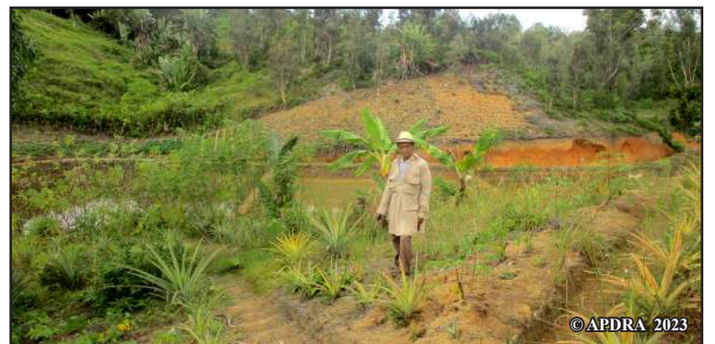
Dadan'i Benja eo afovoan'ny toeram-pamokaran'ny efa voajary

liana tamin'ireo teknika ireo ka nampihatra izany tany aminy. Nahaliana mpamokatra hafa, tsy mpiompy trondro, ireo fanajariana rehetra ireo, ka niteraka fifanakalozana mikasika lohahevitra ankoatra ny fiompiana trondro teo amin'ny vondrona. Nisy tamin'ireo mpiray vohitrindrina aminay no tonga taty ary nangataka ny hitsidihana ny toeram-pamokaran'izy ireo mba hahazoana tohana ara-teknika amin'ny fanajariana dobo sy tanety. Toeram-pamokaran'olona am-polony maniry ny hanajary no efa voatsidikay. »