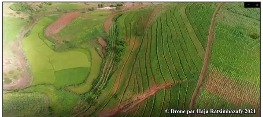
Tsipi-mira haabo nohajariana tsara

Rakotondramanana : Tokony hialana ireo fomba fiasana ny nofon-tany fanao ankehitriny. Tokony hidirana ny fomba famokarana miaro ny tontolo iainana ary arovana araka izay tratra ny sahan-driaka. Iankinan'ny hoavin'ny tantsaha malagasy izany !