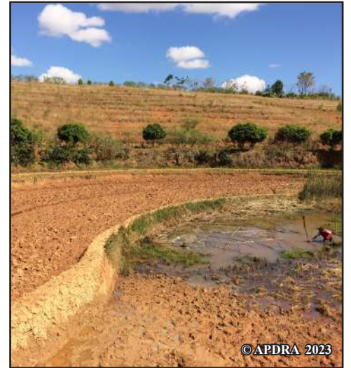
Sahan-driaka kely voajary tsara

ny fampiasam-bolako. Herintaona sy tapany taty aoriana, nanomboka niverina ny loharano namelona ny tanimbariko, niverina namboly vary an-drano indray aho ka nahavokatra vary 15 gony amin'ny 60 kg isany. Tamin'ity taona 2023 ity dia nofefeko zava-maniry ny moron'ny tanimbary ary nampidirako zana-karpa miisa 130 sy marakely vitsivitsy tao anatin'ny. Fahombiana hatrany no azo : niakatra ho 17 gony ny vokatra, ary mino aho fa hihatsara hatrany izany satria efa nasiako zezika organika tao an-tanimbary ! »