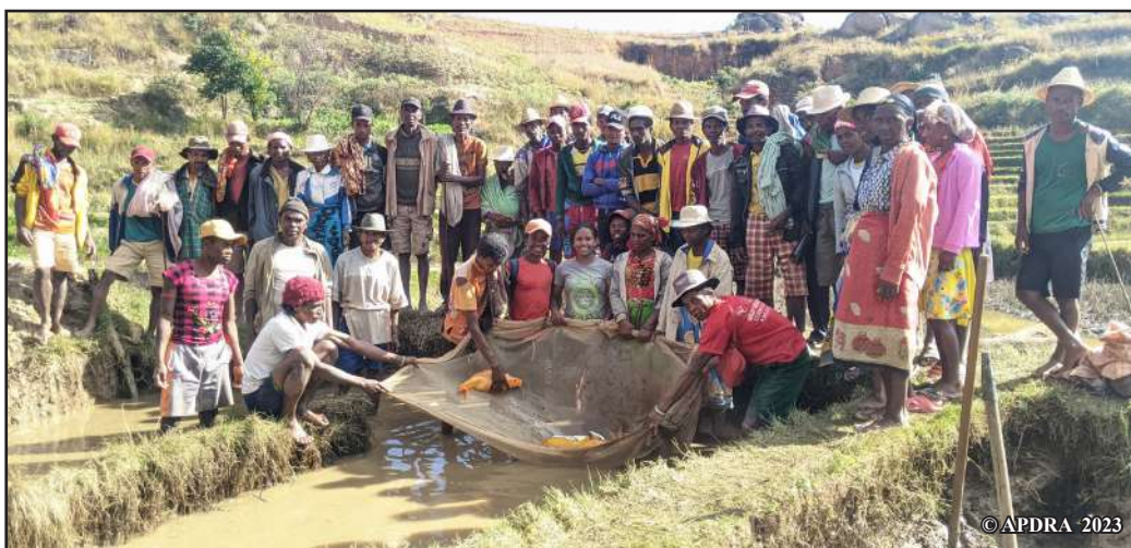
Fampiofanana ifotony mikasika ny fisafidianana raïaman-drenitrondro tao amin'ny fari-piasana Antoby, kaominina ambanivohitra Ambatamarina, Amoron'i Mania

amin'ireo mpamokatra madinika izay mitombo isa hatrany ho an'ny fampandrosoana ny fiompiana trondro an-tanimbary, ny fanatanterahana io composante io. Mpiompy trondro miisa 6600 no mamokatra zana-trondro karpa manodidina ny 3,6 tapitrisa sy trondro 126 taonina isan-taona tao anatin'ny 6 taona. Homen-danja eo anivon'ireo tetikasampampandrosoana vaovao eo amin'ny fiompiana trondro tantanan'ny tantsaha eto Madagasikara any amin'ireo faritra ireo, na ny faritra hafa, ny vokatra sy ny fahaiza-manao azo tamin'ny fanatontosana io composante io !