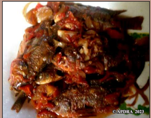
Tena mety ilaofana vary ny tilapia saosy