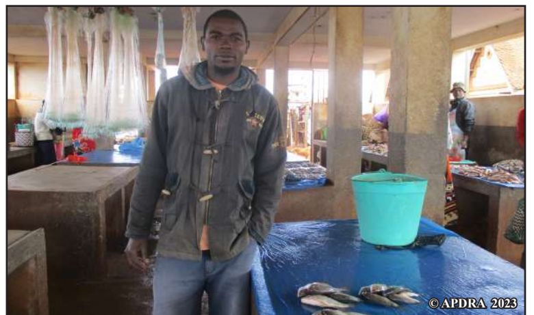
Bôda eo am-povoan-tsenda fivarotana trondro ao Antanimalalaka, Ambalavao

mifampiantso hifanarahana amin'ny daty akana trondro, ny vidiny sy ny fatra misy alohan'ny hidinana eny ifotony. »