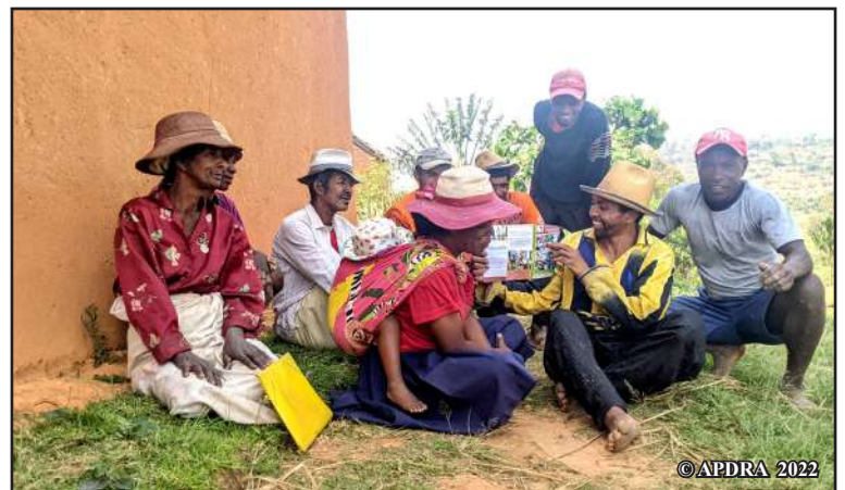
Mpikambana ao amin'ny Voahirana eo am-piresahana ny fampiasana ny lahatahirin'ny mpivarotra

Anisan'ny antony nananganany ny fikambanana tamin'ny 2019 ny fitadiavana paikady hanamorana ny famarotana zana-trondro sy trondro vaventy. Nandray anjara tamin'ny fanatrarana io tanjona io ny fisian'ity lahatahiry ity ! »