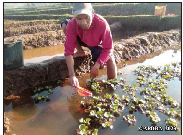
Nary eo am-panaraha-maso ny famokarany zana-trondro

Nary : Ahazoana tombony kokoa ny mivarotra zana-trondro ivelan'ny faritra rehefa tery ny tsena eto an-toerana, mila fandaminana betsaka sy traikefa tsara anefa ny fitaterana satria zana-trondro velona no entina. Ankoatra izay, mandany ny ankamaroan'ny fotoanako ny fanaterana ny vokatra ka izany no mahatonga ahy hampiasa olona mba hanampy ahy, indrindra amin'ny famokarana sy ny fanomanana ny kaomandy.