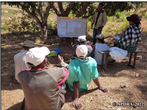
Fampiasana ny fitaovam-pitantanana niaraka tamin'ny mpiompy trondro mpikambana ao amin'ny TAMIKA ao Antanetikely

Olana mpahazo ny mpiompy trondro ny tsy fahazoana zana-trondro, indrindra ho an'ny mpiompy vao. Mpamokatra maro ihany koa anefa no manana fahasahiranana amin'ny fivarotana ny zana-trondrony. Manoloana izany dia namorona fitaovana iray ny APDRA hanampiana ny mpiompy trondro sy ny mpanentana amin'ny fandalinana ireo olana mitranga eo amin'ny tsenan'ny zana-trondro, ny fandinihana miaraka ny mety ho vahaolana sy ny famaritana ny paikady famarotana ho tombontsoan'ny rehetra, mpivarotra sy mpividy.