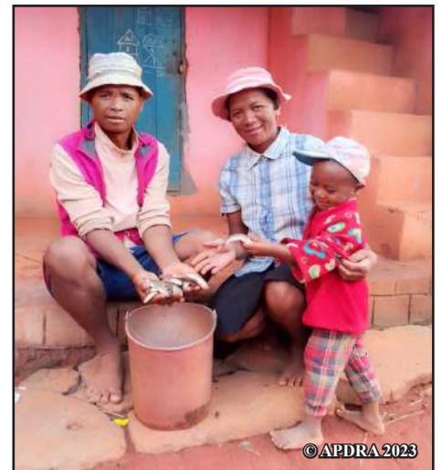
Nirina sy ny vady aman-janany

Te hamokatra zana-trondro karpa izahay saingy mbola tsy mahazo rano ny tanimbarinay. Eo ampitadiavana vahaolana miaraka amin'ny fikambanan'ny mpampiasa rano ao Mangarano izahay amin'izao. Rehefa mahazo rano tsara izahay dia hamokatra zana-trondro. »