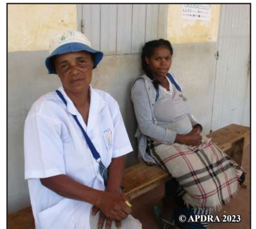
Rahoby (eo ankavia) dia mpanentana eo anivon'ny Ofisim-paritry ny Fanjarian-tsakafo

Hotohizako ny fanentanana ireo vehivavy izay tsy mbola nanapa-kevitra. Hamporisihiko ihany koa ireo vehivavy mpiompy mba hifanaraka amin'ny mpamokatra zana-karpa roa eto antoerana hahazoany izay zana-trondro ilaina, na hotolorako fiofanana mikasika ny teknikam-pamokarana zana-trondro. »