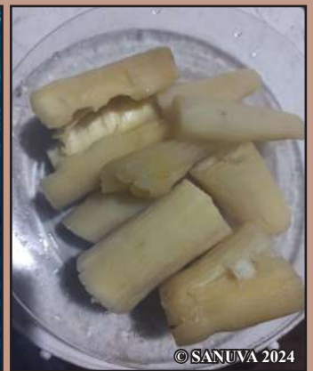
Sakafo ara-pahasalamana ny mangahazo sy ny trondro