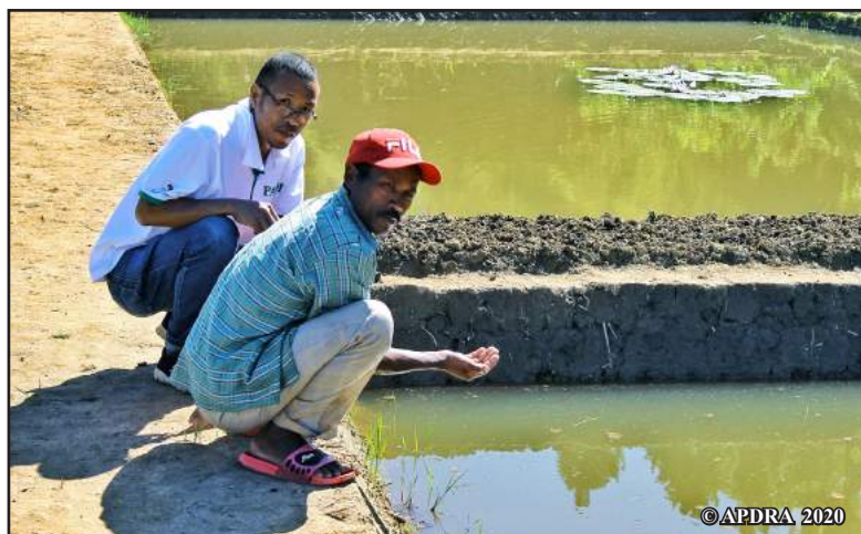
Fanombohana ny andrana mikasika ny fikarohana

«Am-polo taona maro izay no nanatavizako karpa, tsy namokatra zana-trondro anefa aho fa nividy tamin'ireo mpamokatra tsy miankina.