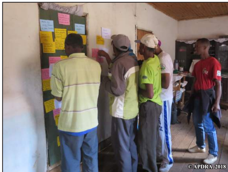
Asam-baomiera natao tamin'ny atrikasa fikarohana

Natao tany amin'ny mpiompy trondro iray tao Mandritsara (Betafo, Vakinankaratra) ny atrikasa. Fifampiresahana teo amoron'ny tanimbary fiompiana trondro, izay nahafahan'ny tsirairay naneho ny olana nosedrainy tamin'ny fiompiana karpa an-tanimbary, no nanombohana azy. Nampahafantarina koa ny sakana hitan'ny APDRA tamin'ny fanadihadiana natao mikasika ny rojom-pihariana. Nifantoka tamin'ny olana izay tsy voavahan'ny tantsaha ka nilainy fandalinana avy eo ny resaka. Nangataka ny hanaovana ho lohalaharana ny fahaveloman'ny zana-trondro, heverina ho ratsy, ny mpiompy trondro ary nanome tsirin-kevitra fanatsarana maro : famahanana zana-trondro, ady amin'ny mpihaza trondro (izay mamono ny zana-trondro) sy ny mpifaninana amin'ny trondro (izay mitovy sakafo fihinana amin'ny zana-trondro ka manakana ny fitombony). Azon'ireo mpikaroka tonga nanatrika tsara ireo olana ireo ary nahafahany namorona fanontaniana enti-miasa amin'ny