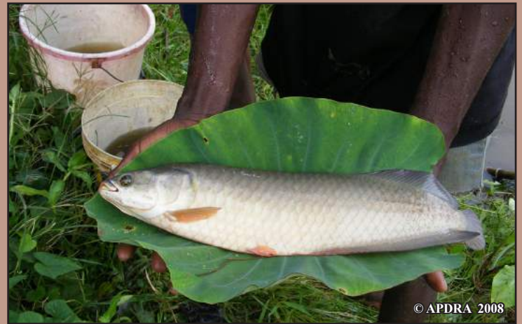
Vangolaopaka vao avy nalaina