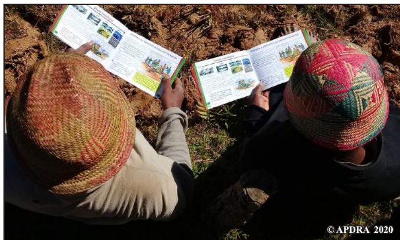
Mpiompy trondro mamaky ny boky kely

Mamintina ny fikarohana ara-tsiansa mikasika ny fahamaroam-pirazanan'ny karpa natao teto Madagasikara ity lahatsoratra ity. Haseho aorian'izay ny fijoroana vavolombelona ataon'ny mpiompy trondro iray nandray anjara tamin'ny fanandramana sy ny soa noraisiny tamin'izany.