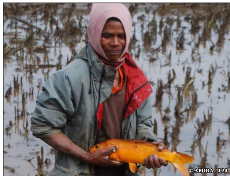
Jeannot mitazona reninondro

100 000. Eo anelanelan'ny volana septambra sy ny volana martsa amin'ny taona manaraka ny fotoam-pamokarako. Ampanatodiziko afara ny ankamaroan'ny reninondroko (70 %). Tsy vaovao amiko ny fampanatodizana karpa afara, ny fandraisana an-tsoratra tsy maintsy atao kosa anefa no nanahirana tamin'ny fikarohana natao. Tsy mahazatra ahy ny manoratra sady tsy mahita tsara ny masoko hany ka ny zanako no mameno ny taratasy ampiasaiko. Niasa irery aho taloha tamin'ny fanatsarana ny teknikako. Ny fandraisana anjara tamin'ny fikarohana no niarahako niasa tamin'ny mpikaroka sy mpamokatra zana-trondro hafa. Nahazoako tombony betsaka io fiaraha-miasa io. Afaka nanatsara ny teknikam-piompiano nohon'ny fiofanana maro sy ny famokarako zana-trondro aho. Nanandrana teknika hafa, toy ny famokarana artifisialy, koa aho ary nianatra nampiasa fitaovana toy ny oxymètre , ny pH-mètre , ny thermomètre , ny microscope , ny disque de Secchi ... »