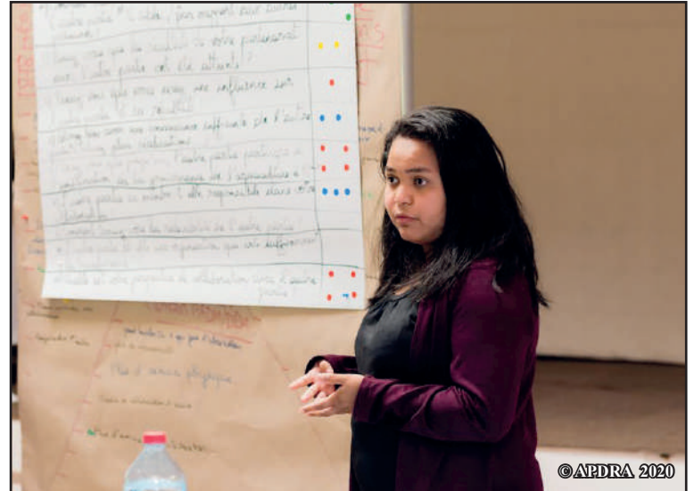
Irajanahary Ekembahoaka Nivo Ravohasambarana nandritra ny atrikasa iray mikasika ny rojom-pihariana

entinay miantoka ny fampandraisana anjara tanteraka ny rehetra. Io fampandraisana anjara io no tena fototry ny fahombiazan'ny fomba fiasa iray amin'ny fiovàna tiantika hotratrarina.