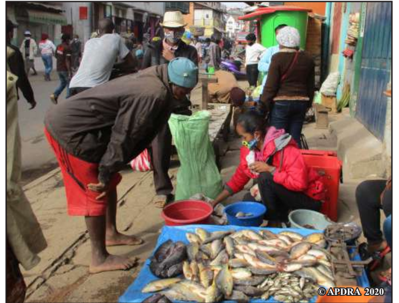
Fivarotana trondro matavy nataon'ny fikambanana mpiompy trondro iray tao an-tsenan'Ambositra

Ireo vokatra ireo no ahafahana milaza fa ny asa natao tao anatin'ny fomba fiasa rojom-pihariana dia nahazoana namaly ireo sakana lehibe sasany eo amin'ny fampandrosoana ny fiompiana trondro an-tanimbary ataon'ny tantsaha.