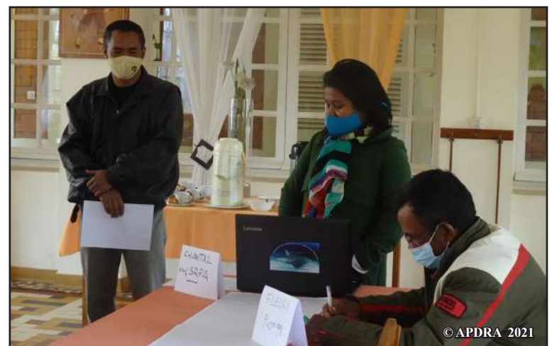
Kabary fanokafana ny dinika an-databatra boribory mikasika ny halatra trondro tao Vakinankaratra nataon'i Koko Chantal de Cupertino

Mitaky ezaka lehibe avy amin'ny mpisehatra samihafa io fomba fiasa io. Ankoatra izay, nandritra ny fanatanterahana ny dinika an-databatra boribory dia tsy maintsy fantarina ireo olona asaina araka ny lohahevitra dinihina. Vitanay ny nanangana tambazotra ivondronan'ny mpisehatry ny rojom-pihariana trondro eo anivon'ny faritra Vakinankaratra, ahafahanay mampahomby ny fandrindrana ireo asa hatao izany. »