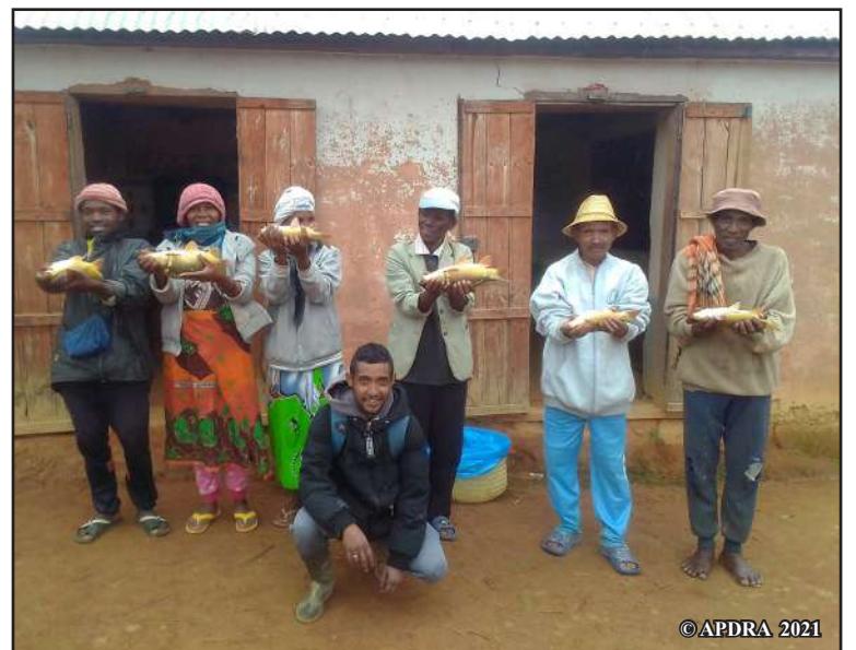
Faly amin'ny vokatra azony ireo mpiompy trondro ao amin'ny fikambanana Farihy

Ny alatsinainy 6 desambra 2021 no natolotra teo amin'ny fitsarana tao Ambositra ny raharaha. Ny 13 desambra 2021, namoaka didy ny fitsarana ka figadrana 12 volana miampy lamandy 800 000 Ariary no sazin'ireo meloka. Andraikitra amin'ny maha-filohan'ny fikambanana sy ny vovonan'ny mpiompy trondro eo anivon'ny kaominina