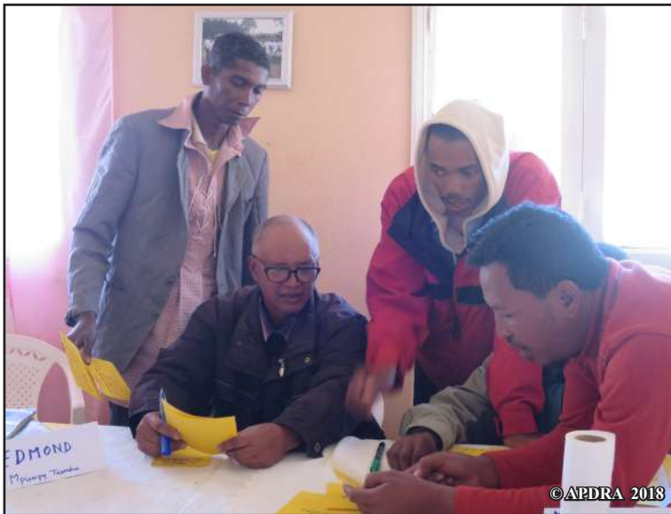
Fivorian'ireo mpisehatry ny rojom-pihariana trondro ao amin'ny faritra Itasy

Solofo : Hiarahamiasa amin'ny tetikasa AMPIANA 2, izay tanterahin'ny APDRA ao amin'ny distrikan'Arivonimamo, mikasika io lohahevitra io izahay amin'izao mba hampandraisana anjara ny distrika rehetra ao Itasy. Vao avy nanatontosa fandaharana an'onjampeo izay miresaka ny halatra trondro sy ny lalàna mifanaraka amin'izany niaraka tamin'ireo mpiara-miasa tao amin'ny AMPIANA 2 izahay izao. Vinavinanay ankehitriny ny hikorakora atrikasa mikasika ny lohahevitra halatra trondro miaraka amin'ny fitsarana, ny mpitandro filaminana, sns. Mampisy fientanana tena mahaliana ny fiarahamiasan'ny rehetra ary mety nahazoana tolo-kevitra tena manan-danja !