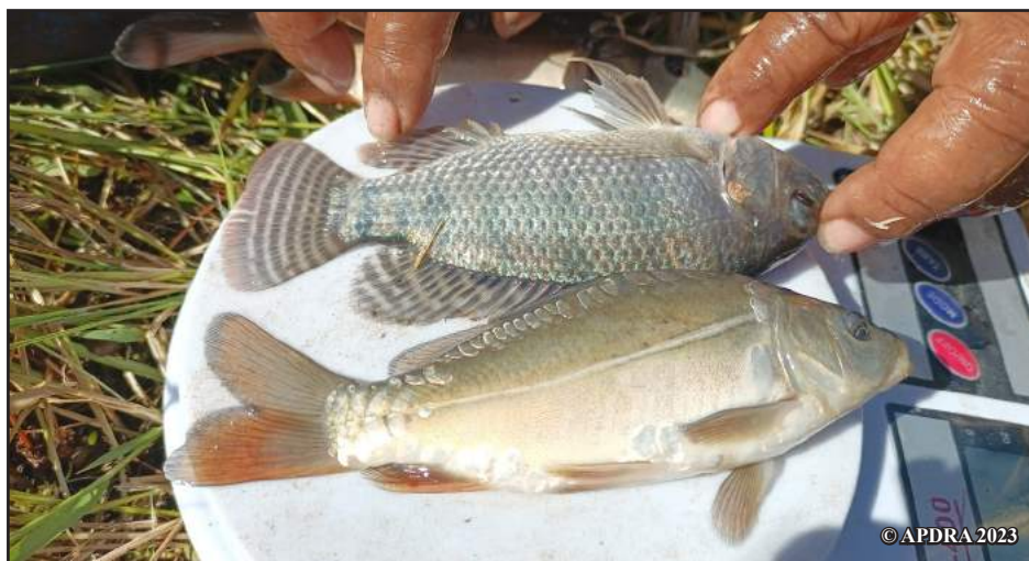
Ny tilapia sy ny karpa no karazan-trondro be mpiompy indrindra eto Madagasikara

Taorian'ny karpa no nampidirana karazana tilapia maro. Hoampafantarina ao anatin'ny lahatsoratra manaraka izany. Anisan'ireo karazan-trondro fiompy miavaka koa ny vangolaopaka ( Heterotis niloticus ) nafarana tany Afrika tamin'ny taona 1964 sy ny trondro mpihaza roa : ny black bass ( Micropterus salmoides ) izay tonga tamin'ny 1950 sy ny fibata ( Channa striata ) - nampidirina tamin'ny daty tsy fantatra - izay manimba zavatra any amin'ny mpiompy trondro kanefa tena ankafizin'ny any amin'ny firenen-kafa.