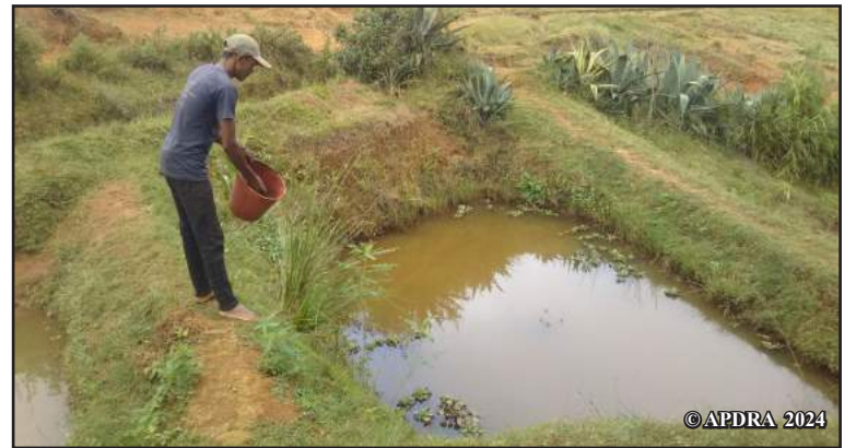
I Bezaka dia mpamokatra zana-trondro ao Mananetivohitra

*Tetikasa tarihin'ny ONG AgriSud, miaraka amin'ny APDRA, sy vatsian'ny Commission de l'Océan Indien sy ny Union Européenne vola miaraka