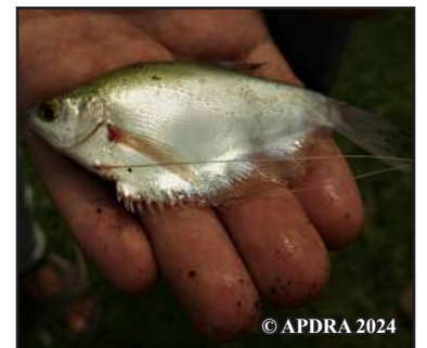
Karazan-trondro any Cambodge : ny silure (ambony ankavia), ny perche grimpeuse (ambony ankavanana), ny panga (ambony ankavia), ny gourami clair de lune (ambony ankavanana)