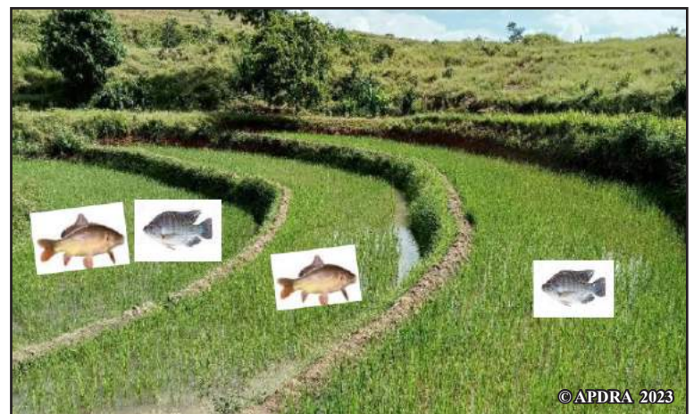
Tanimbary fiompiana karpa sy tilapia

Ireo andrana voalohany ireo dia maneho fa tsy tokana ny vahaolana amin'ny fiompiana trondro ka ilaina hatrany ny manao andrana sy mampifanaraka ny teknika amin'ny tanimbary sy ny fitaovana ananana. Asehon'izany koa fa azo trandrahana ny fiompiana ireo trondro ireo, ankoatra ny karpa, sy mamporosika ny fanohizana ny asa mikasika izany.