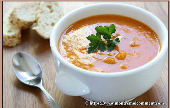
Ahavitana lasopy matsiro ny trondro sy ny vomanga