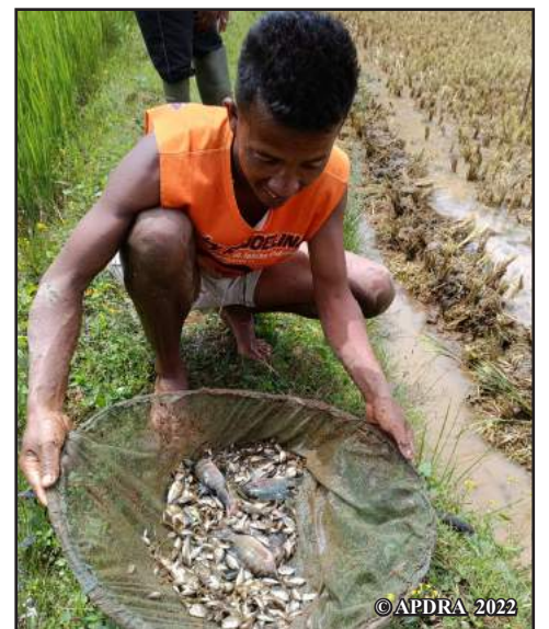
Ahitana marakely betsaka ny renirano sy ny tanimbary ao Anjozorobe

Nohon'ny fangatahan'ny mpiompy trondro dia nifantoka tamin'ireo fampiharana ireo ny APDRA ary miaramiasa amin'izy ireo mba hamaritana izay fomba hanatsarana ny fiompiana ataony.